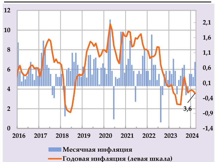
Рост группы потребительских цен и их вклад в структуру годовой инфляции, в %