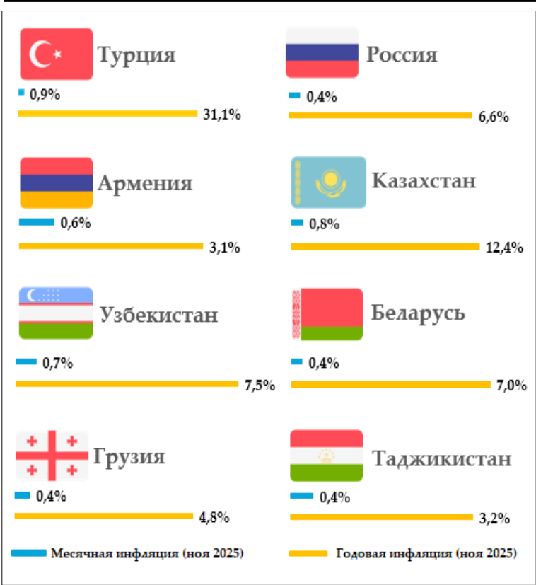
Уровень инфляции в регионе (в процентах) (источник: Статистические органы соответствующих стран)

Национальный банк Таджикистана будет продолжать реализацию эффективной денежно-кредитной политики с целью сохранения стабильности внутренних цен и предотвращения инфляционных давлений.