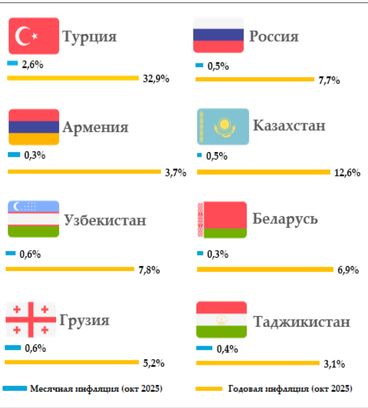
Уровень инфляции в регионе (в процентах)

Национальный банк Таджикистана будет продолжать реализацию эффективной денежно-кредитной политики с целью сохранения стабильности внутренних цен и предотвращения инфляционных давлений.