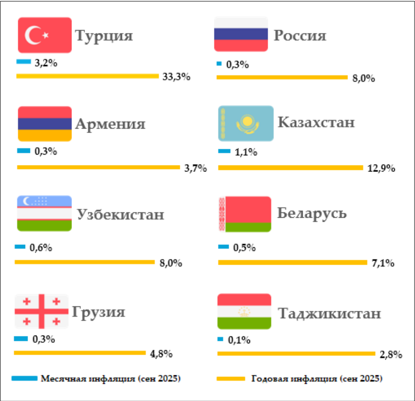
Уровень инфляции в регионе (в процентах) (источник: Статистические органы соответствующих стран)

Национальный банк Таджикистана будет продолжать реализацию эффективной денежно-кредитной политики с целью сохранения стабильности цен и предотвращения инфляционных давлений.