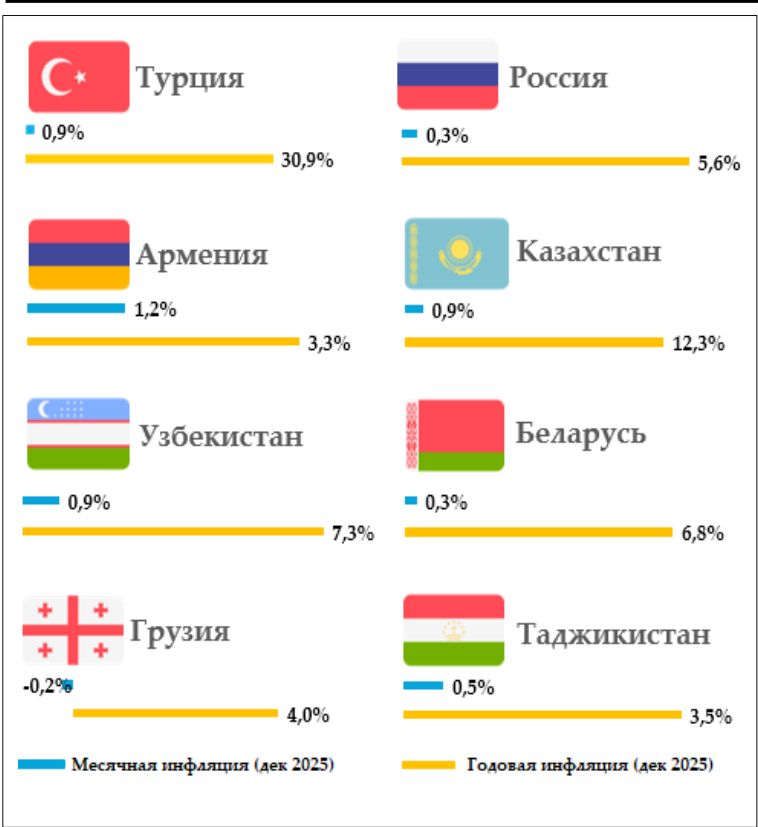
Уровень инфляции в регионе (в процентах)

Национальный банк Таджикистана будет продолжать реализацию эффективной денежно-кредитной политики с целью сохранения стабильности внутренних цен и предотвращения монетарных инфляционных давлений.