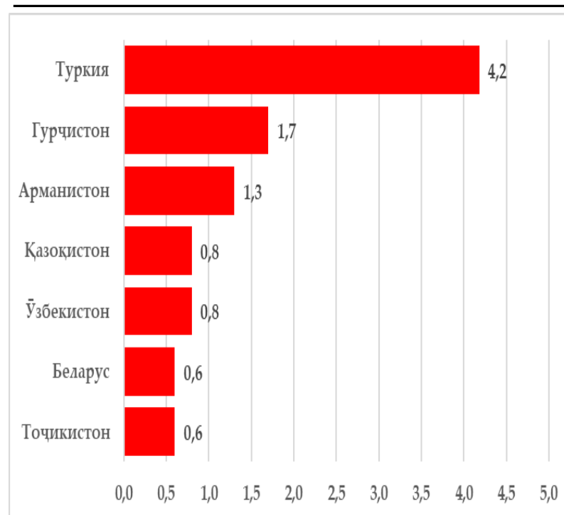
Таварруми моҳи дар моҳи апрел дар кишварҳои шарикони асосии савдо ва минтақа бо фоиз

Бо мақсади дар доираи ҳадафи муқарраршуда, нигоҳ доштани сатҳи таваррум Бонки миллии Тоҷикистон татбиқи сиёсати самараноки пулию қарзиро бо истифода аз воситаҳои монетарӣ идома хоҳад дод.