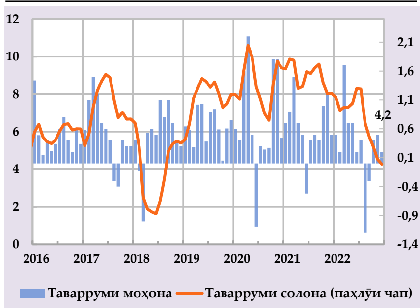
Афзоиши гурӯҳи нархҳои истеъмолӣ ва саҳми сохтории онҳо дар таварруми солона, бо % (манбаъ: Агентии омор, ҳисобҳои БМТ)