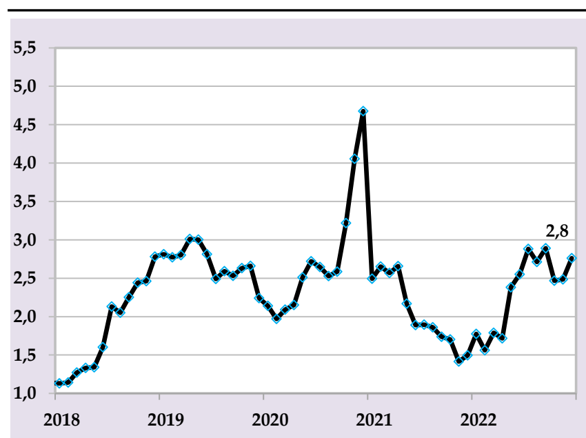
Таварруми аслии солана, бо %