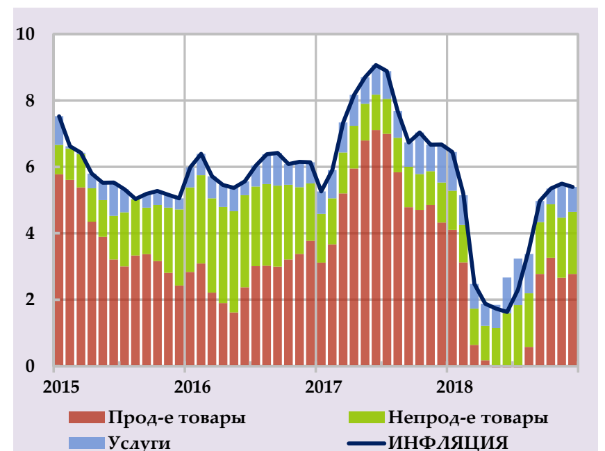
Целевой показатель годовой инфляции в среднесрочном периоде, в %