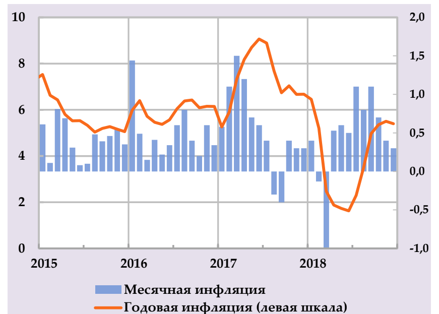
Рост группы потребительских цен и их структурный вклад, в % годовых