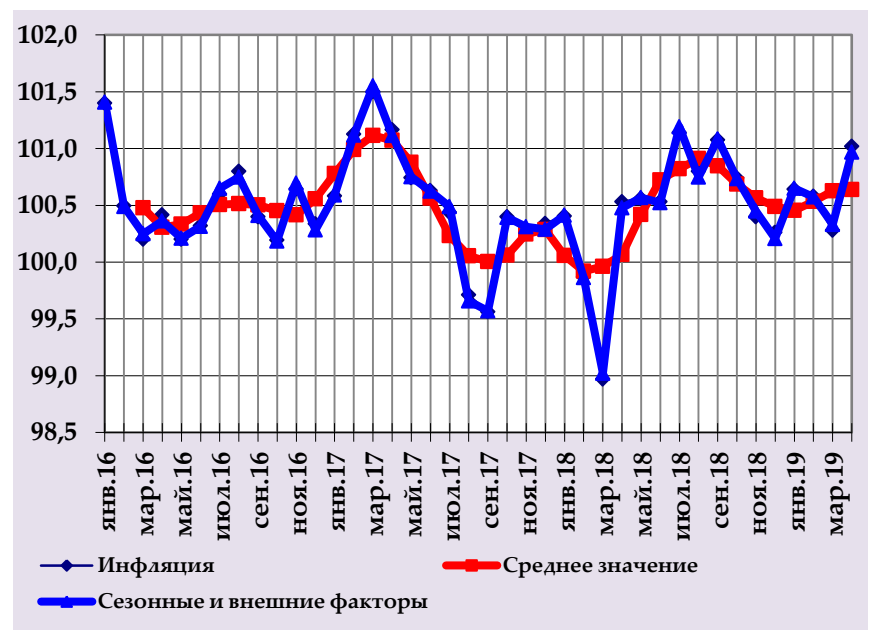
Рост группы потребительских цен и их структурный вклад, в % годовых