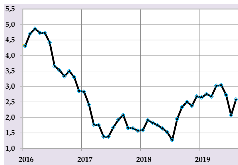
Базовая инфляция, в % годовых

В целях предотвращения дополнительных давлений на уровень инфляции и достижения до конца года предусмотренного целевого показателя, Национальный банк Таджикистана продолжит реализацию сбалансированной эффективной денежно-кредитной политики.