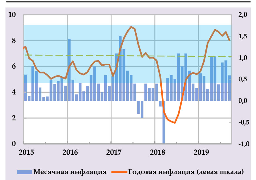
Влияние сезонных и внешних факторов на инфляцию, в % (источник: Агентство по статистике, расчёты НБТ)