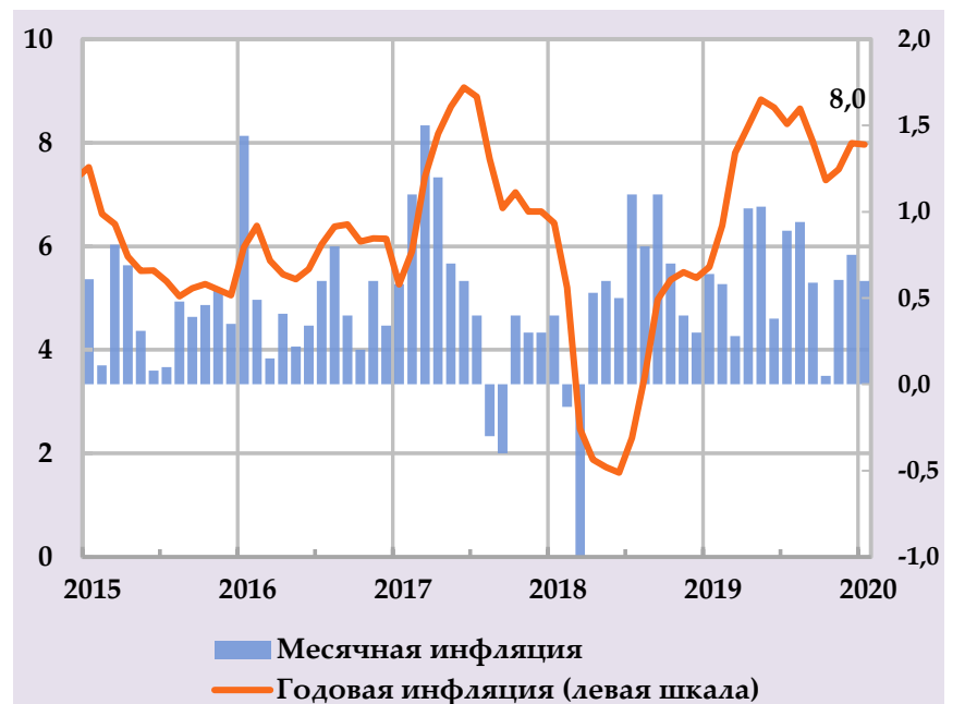
Изменение цены картофеля и лука, в % годовых