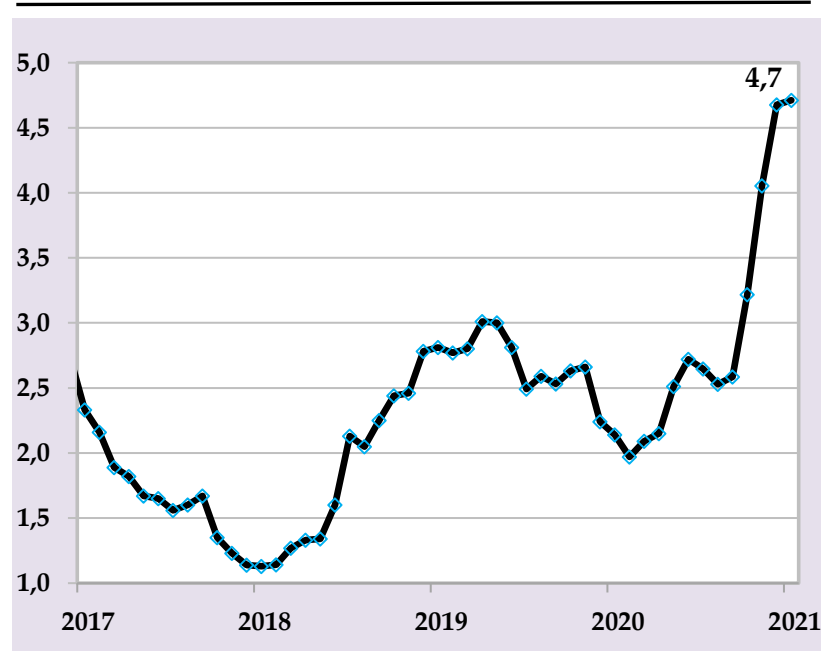
Таварруми аслии солона, бо %, (манбаъ: Агентии омор, ҳисобҳои БМТ)

Бонки миллии Тоҷикистон бо мақсади пешгирӣ ва бартараф намудани фишорҳои иловагии таваррум бо истифода аз воситаҳои монетарӣ татбиқи сиёсати мутавозуни пулиро қарзиро идома хоҳад дод.