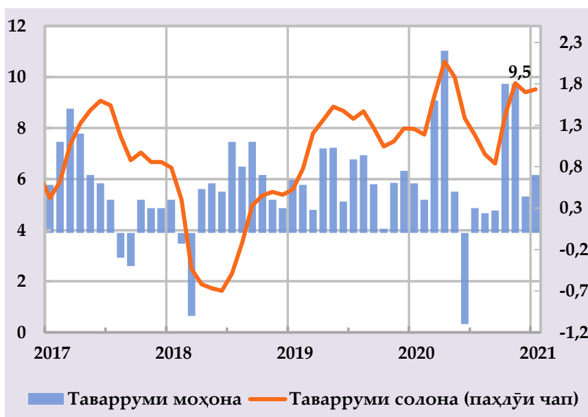
Тағйирёбии намояи нархи шакар ва рағғани пахта, бо %, моҳона