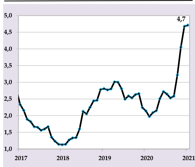
Базовая инфляция, в % годовых

В целях предотвращения дополнительных давлений на уровень инфляции Национальный банк Таджикистана продолжит реализацию сбалансированной денежно-кредитной политики посредством использования монетарных инструментов.