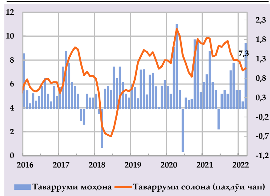
Афзоиши гурӯҳи нархҳои истеъмоли ва саҳми сохтори онҳо дар таварруми солона, бо % (манбаъ: Агентии омор, ҳисобҳои БМТ)