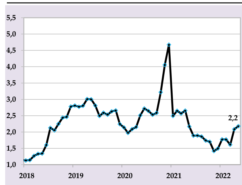
Таварруми аслии солона, бо %