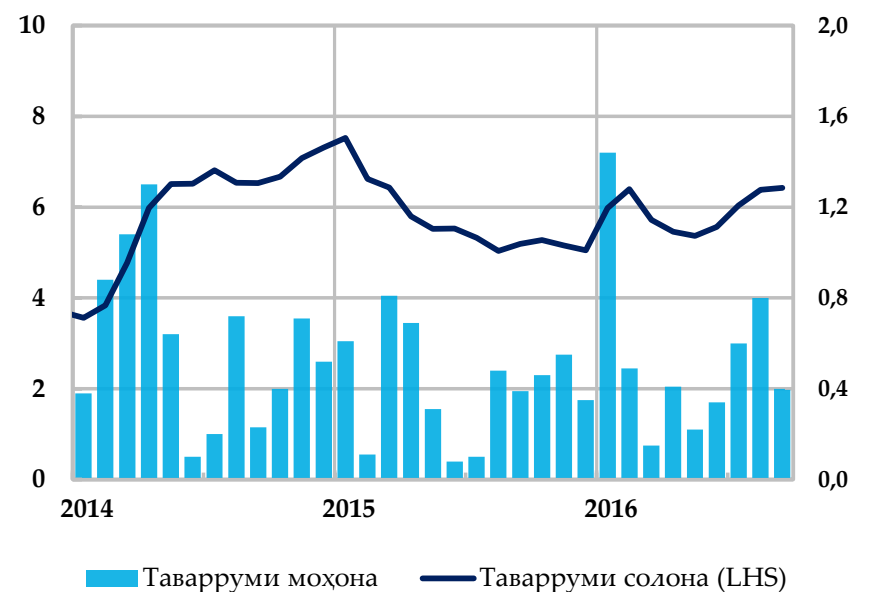
Таварруми солона ва сатҳи сохтори он, бо %