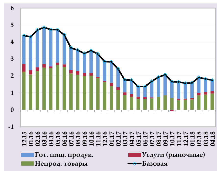
Небазовая инфляция, в % годовых